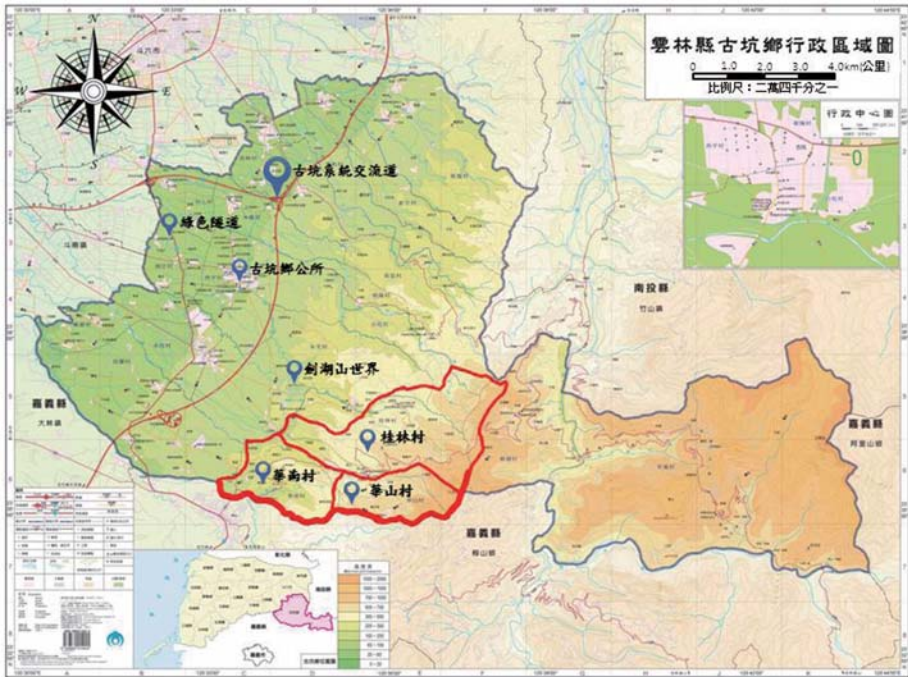
圖1. 古坑鄉華山地區地理位置圖 (引用內政部，2014)